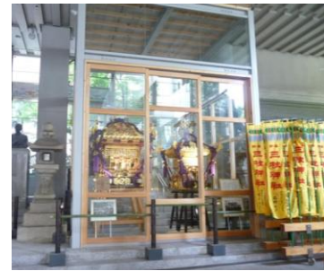
五反田、雉子神社様の 神輿展示室

ご来社いただいた方に、お茶をお出しするように心がけています。当たりまえのことですが、お茶を飲みながら会話する事で、お互いに気持が伝わり温かい心になって、喜んでいただけ、ちょっとした心づかいで、人間関係がスムーズになるような気がします。