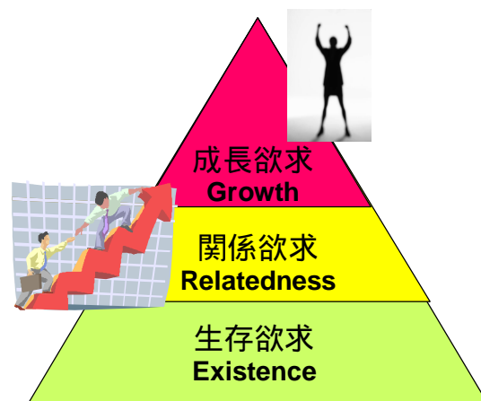
図1 アルタファアの欲求理論「ERG理論」

私は顧客ニーズを、生存欲求には「安心&安全」、関係欲求には「便利」、成長欲求は「快適」と言ったキーワードを割り当てて捉えています。おそらく、マナーは関係欲求を満たすための行動の中で活かされるケースが多いと思います。更に一歩進んで、マナーがスマートで、ファッションブルなものとして表現できれば、成長欲求が強い人達の好奇心を掻き立て、新たな展開が図れる可能性が在るかもしれません。