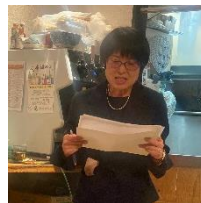
南花天の会副会長 兼本会プロジェクトリーダー