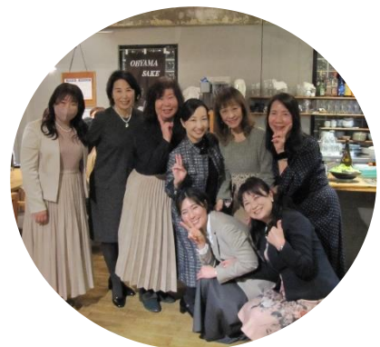
10期生、11期生、14期生 16期生、17期生、18期生